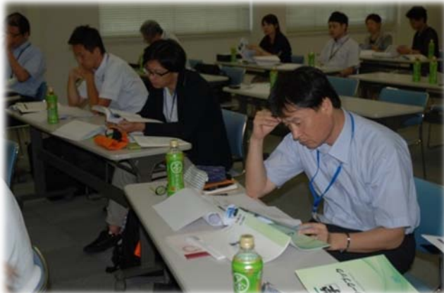
教員研修会の様子

本研修では「親学」を授業カリキュラムに導入するための、科目立ち上げから実施方法まで詳しくご説明いたします。また、模擬授業も行いますので、授業展開もご確認いただけます。