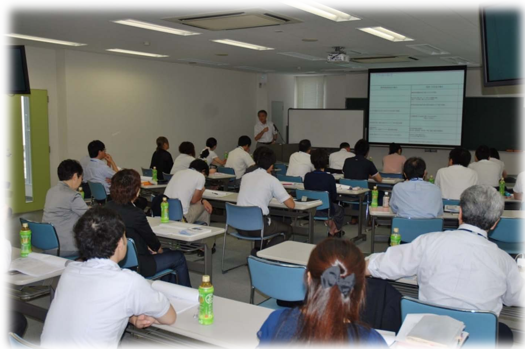
教員研修会の様子