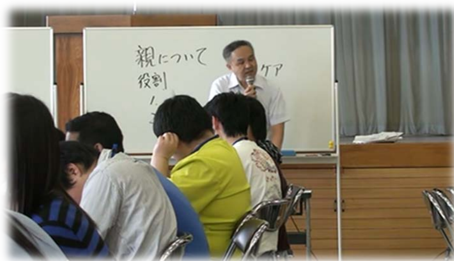
専門学校での実際の授業

つまり「親学」は「親になるための学び、親としての学び」であるとともに、人間として成長するための学びでもあります。これから親になる学生たちが「親学」を学ぶことによって、これからの時代を担う大人として成長し、自分自身に誇りと自信を持ってもらいたいと考えております。