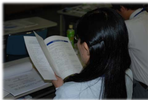
教員研修会の様子